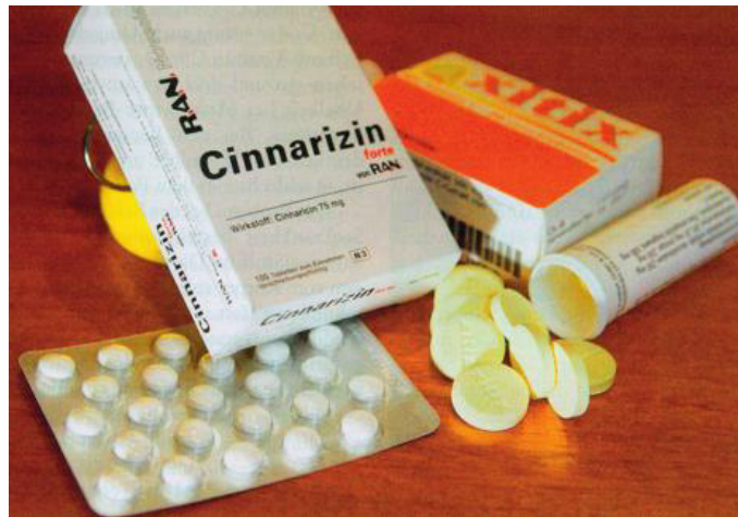
Medikamentenauswahl zur Bekämpfung der Seekrankheit